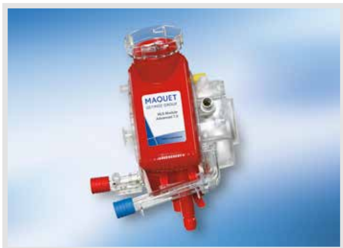
HLS модуль Advanced 7.0