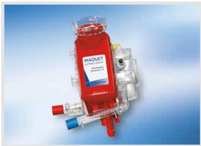
HLS Модуль Advanced 7.0