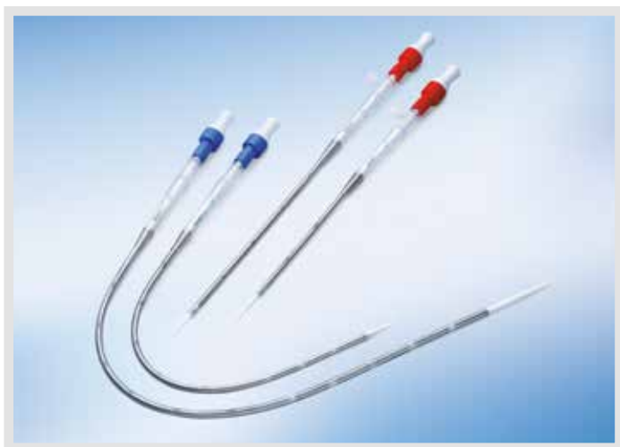
Периферические HLS канюли

Периферические HLS канюли от MAQUET применяются для обеспечения длительной экстракорпоральной мембранной оксигенации. Эти канюли могут быть легко и безопасно введены чрескожным доступом по методу Сельдингера или с помощью хирургического надреза. Периферические HLS канюли произведены из биологически совместимого полиуретана и, как и все компоненты набора расходных материалов HLS, покрыты BIOLINE. Их тонкие стенки обеспечивают оптимальный кровоток с минимальным падением давления. Все периферические HLS канюли армированы для гарантии высокой гибкости и устойчивости к перегибам, особенно при долгосрочном использовании.